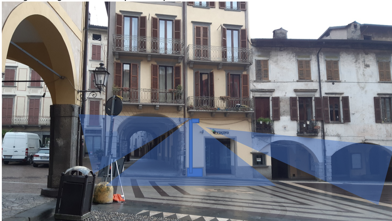
Immagine 6: Ingresso zona ZTL – punto di ripresa D

Posizionamento di panchina o fioriera o cestino rifiuti palo per posizionamento telecamere di videosorveglianza e ZTL e cartello informativo turistico.