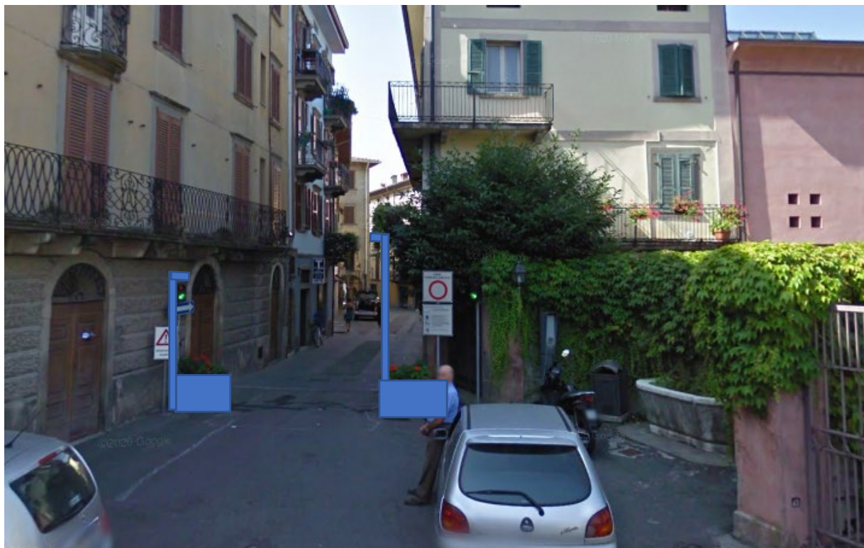
Immagine 4: Ingresso zona ZTL – punto di ripresa B

Posizionare fioriera, cartello informativo videosorveglianza-ZTL e per centro storico e fontane, palo e telecamere