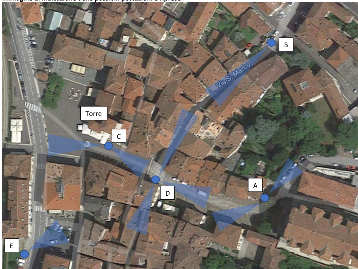
Immagine 1: indicazione delle possibili postazioni e riprese

Con il presente documento si intende esporre e illustrare gli obiettivi per l'affidamento diretto, mediante indagine di mercato per la presentazione della manifestazione di interesse.