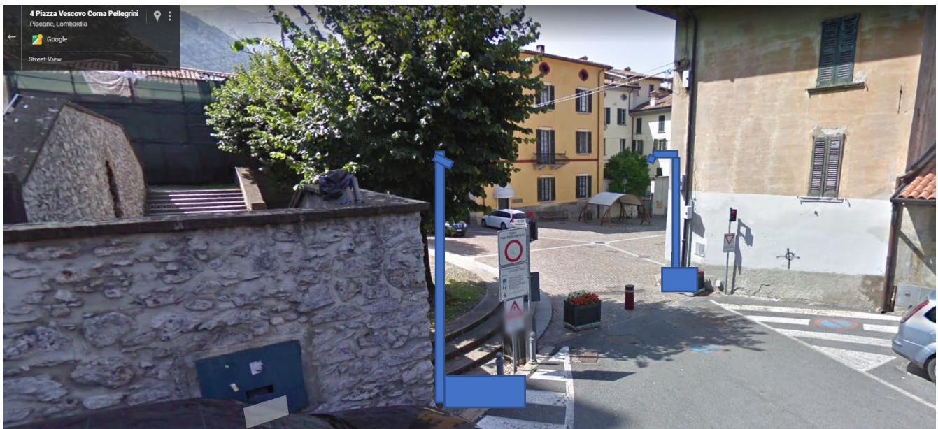
Immagine 3: Ingresso zona ZTL – punto di ripresa A

Posizionamento di fioriera con cartello informativo videosorveglianza-ZTL e informazioni turistiche per centro storico con palo e telecamere. Valutare attentamente le modalità di trasmissione