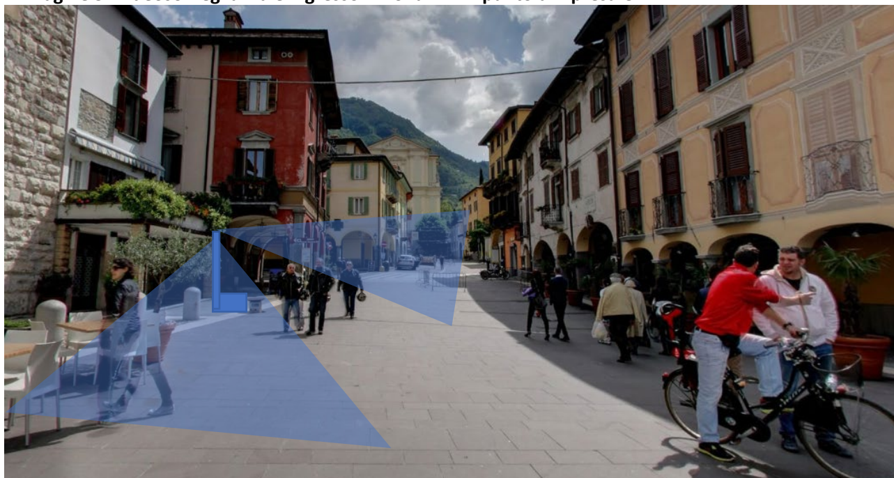
Immagine 5: Videosorveglianza e ingresso in zona ZTL – punto di ripresa C

Posizionamento di panchina o fioriera o cestino rifiuti con inserto per quadro distribuzione energia elettrica in sostituzione del pozzetto ad estrazione dalla pavimentazione – possibilità opzionale di inserimento di cartello informativo per le attività previste nella torre – valutazione di posizionamento di telecamera per videosorveglianza su palo o graticcio con rampicanti anche in posizione diversa dal pozzetto esistente – possibilità di presentare anche più di una postazione (cestino + panchina staccati e distanti ad esempio)