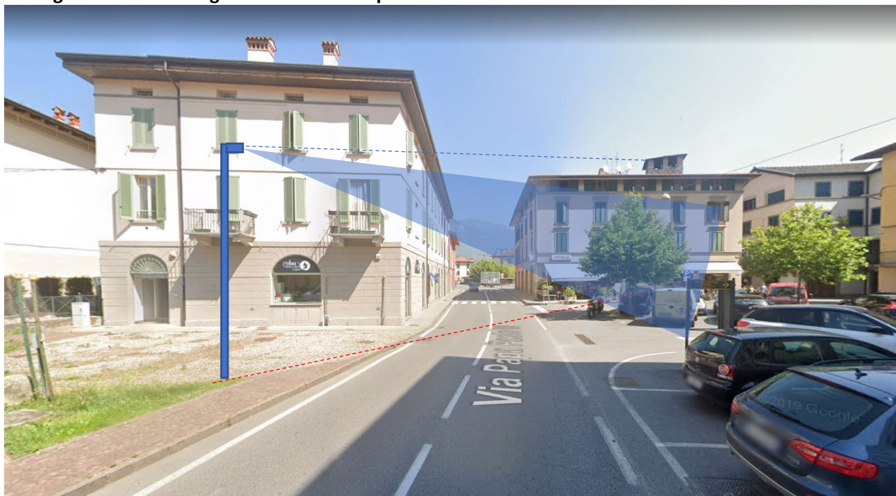
Immagine 7: Videosorveglianza – Punto di ripresa E

Posizionamento telecamera per videosorveglianza (opzionale per eventuale aggiunta al progetto dei precedenti punti) - Punto di ripresa E.